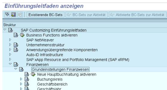
Aktivierung des neuen Hauptbuchs im SAP Customizing